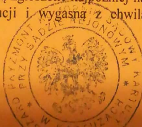
Komornik Sądowy Ryszard Przyzmont

Użytkowanie, służebności i prawa dożywotnika, jeżeli nie są ujawnione w księdze wieczystej lub przez złożenie dokumentu do zbioru dokumentów i nie zostaną zgłoszone najpóźniej na trzy dni przed rozpoczęciem licytacji, nie będą uwzględnione w dalszym toku egzekucji i wygasną z chwilą uprawomocnienia się postanowienia o przysądzeniu własności.